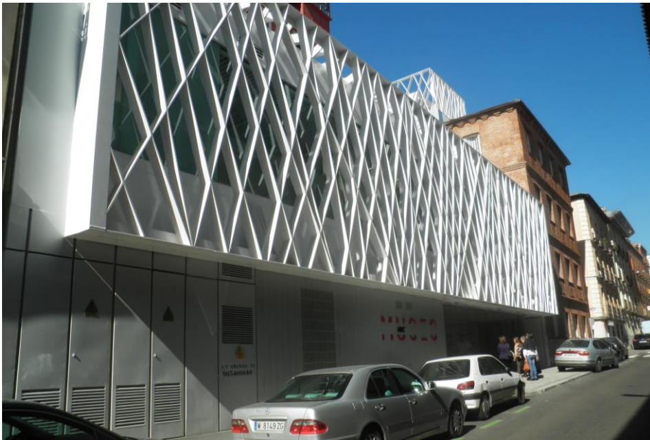
Fig. 12. Museo ABC de la Ilustración, Madrid, febrero 2011.

desde Colón y la Mujer con espejo de Botero al inicio del recorrido de los bulevares para desembocar en nuevos recintos regenerados que se van acercando al Madrid Río. Por un lado, se llega a la Casa de Campo por el Teleférico de Rosales cruzando por el aire el río Manzanares; asimismo desde la Escuela de Cerámica en el Parque del Oeste se llega al recinto de las dos Ermitas de San Antonio de la Florida, al Parque de la Bombilla y a las urbanizaciones cruzando el río por el Puente de la Princesa. Por otro lado, el Paseo de Rosales dirige sus pasos al Templo de Debod en la Montaña del Príncipe Pío, un verdadero mirador a la Casa de Campo (Arroyo, 2015).