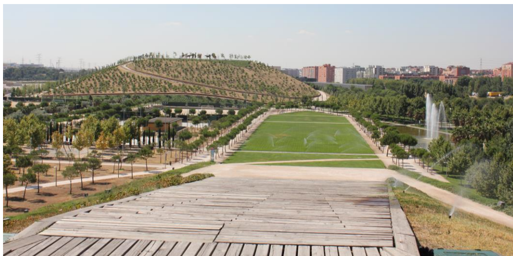
Fig. 15 – Parque Lineal del Manzanares, Madrid Río, 2013.

Finalmente, el Puente de la Princesa y una pasarela dan acceso al Parque Lineal del Manzanares 57 (Usera), que en su conjunto se extiende desde el nudo Sur de la M-30 hasta Rivas Vaciamadrid. Su primer tramo (fig. 15) se finalizó a mediados del 2003 por el taller de Ricardo Bofill. Entre otros, consta de distintos espacios como: Plaza Verde, Paseo de los Sentidos, Pérgola, La Atalaya - donde se encuentra la escultura Ariadna o La Dama del Manzanares de Manolo Valdés-, Área de los Deportes, La Pradera, Parque del Belvedere. Finalmente, desde la Montaña Forestal o el Cerro Coyote se distingue la Caja Mágica (Complejo Deportivo Polivalente) proyecto adjudicado a Dominique Perrault en 2002.