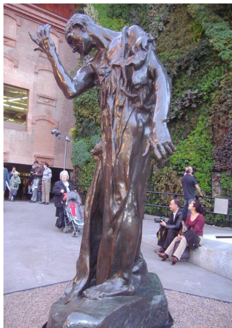
Fig. 6 – Burgueses de Calais de Rodin en Caixaforum, marzo de 2009.

El Museo Nacional Centro de Arte Reina Sofía (MNCARS), antes Centro de Arte Reina Sofía (Arroyo, 1990: 153-157), en el vértice sur del Triángulo del Arte, fue inaugurado en 1992 31 en el edificio que fue antiguo Hospital General de