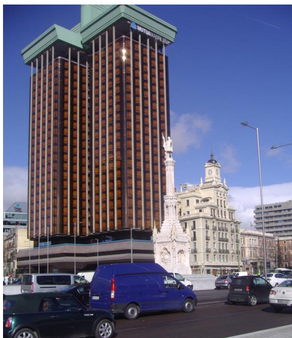
Fig. 3 – Plaza de Colón, febrero de 2010.

Madrid, un aparcamiento subterráneo y el Centro Cultural de Villa -desde febrero de 2008 llamado Fernán Gómez Centro Cultural de la Villa-, cuya historia se detalla en su página web 15 . Situado en el circuito de arte más importante de la ciudad, el centro municipal consta de tres espacios culturales: la Sala Guirau (Teatro), la Sala Jardiel Poncela y la Sala de Exposiciones. Hoy ha desaparecido la fuente alargada original, que servía de límite con la vía de la plaza. Una vez decidido el carácter conmemorativo del proyecto, se homenajeaba dicha plaza a las hazañas del Descubrimiento 16 . La narración del viaje y las profecías que lo anticiparon se ilustra tanto en los relieves e inscripciones de los muros exteriores del Centro Cultural de la Villa como en las tres enormes esculturas públicas, situadas en el límite con la calle Serrano, Monumento al Descubrimiento de América , obra del pintor y escultor Joaquín Vaquero Turcios (Madrid, 1933 – Santander, 2010) e inaugurada el 15 de mayo de 1977 (Fernández, 1982: 178-183).