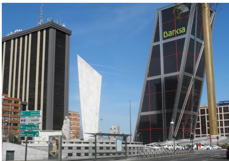
Fig. 1 – Plaza Castilla, Madrid, junio 2012.

Consta de aulas, salas de exposiciones, auditorio para conciertos, conferencias, debates; asimismo integra un gran parque sobre la cubierta del Cuarto Depósito. Muestras como Guerreros de Xi'an en 2004-2005 a la actual, 2015-16, dedicada a Cleopatra y la fascinación de Egipto ; pero ante todo, presta atención especial a todas “las manifestaciones artísticas que nacen de la relación del ser humano con su entorno”. El abanico de disciplinas y lenguajes es, por tanto, muy abierto, aunque sin desviarse de su fin último: hacer que el visitante reflexione acerca de los diferentes aspectos que inciden sobre la conservación del medio ambiente y, en particular, sobre el valor del agua.