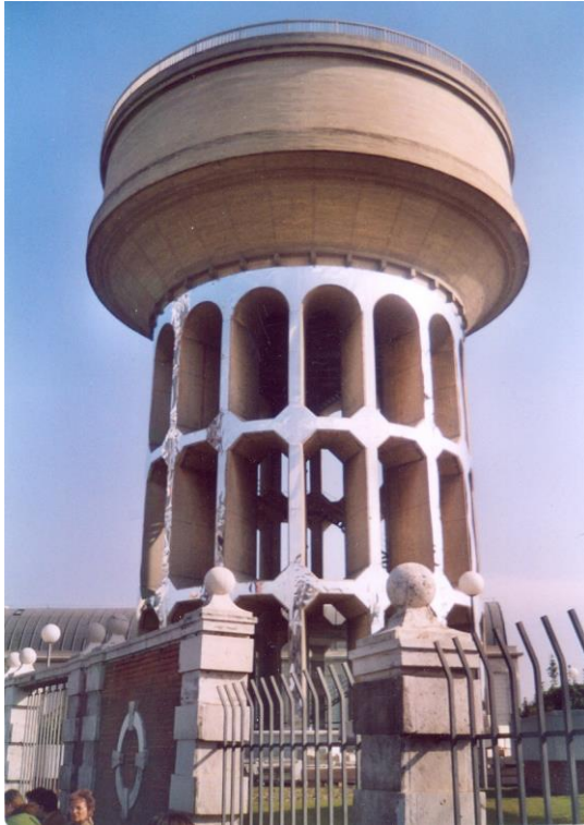
Fig. 7 – Intervención de Sans Façon en el Depósito de Agua del Canal, Plaza Castilla, Madrid Abierto 2004.

edificios más emblemáticos han sido sometidos a una relectura, a recreaciones visuales simbólicas y también críticas. La intervención de Sans Façon 36 en el Depósito de Agua de la Plaza de Castilla, durante el evento Madrid Abierto 2004 (Fig.7), convierte un edificio utilitario en una “escultura” al dotarlo de una ornamentación ajena a su sentido simplemente funcional. De esta forma, este depósito de hormigón que se ha convertido en plateado, pasa a ser foco de las miradas de la gente. Su fin es que los paseantes se fijen y aprecien esa estructura que es emblema de la Plaza y un ejemplo del progreso hidráulico de la ciudad. “Por un período de tiempo, el depósito elevado se convierte en un acontecimiento. Mientras que anteriormente formaba parte de nuestra observación diaria, adquirirá una nueva existencia en la memoria y la imaginación una vez pasada la intervención” 37 .