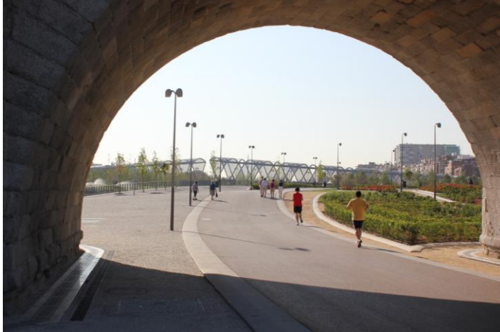
Fig. 13. Puente de Perraut desde el Puente de Toledo, Madrid Río, 2013.

puente gemelo se dirige o al Invernadero (Fig. 14) o al Centro de Creación Contemporánea y recinto del Matadero, escenario de múltiples actividades de ocio y cultura. Un proyecto de las ideas generadas sobre su historia puesta en boca de los habitantes de la zona es Matadero Memoria Aural 56 “Proyecto sonoro de aproximación a la historia y recuerdos del matadero municipal de Madrid y su entorno más inmediato en el barrio de Arganzuela”.