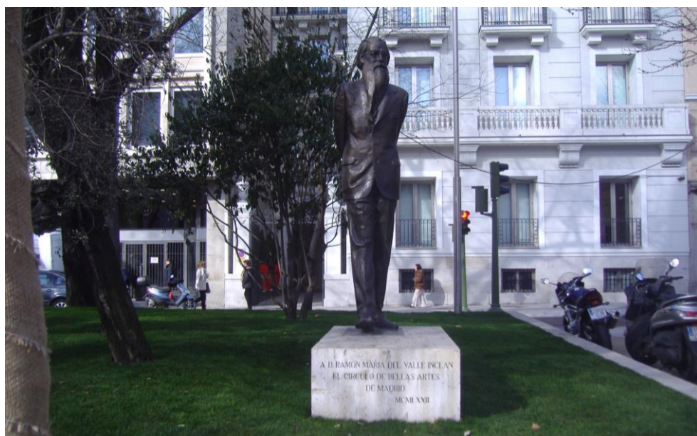
Fig. 4. Estatua de Valle Inclán en el Paseo de Recoletos, febrero 2010.

ciones fotográficas en la cercana calle Bárbara de Braganza, mientras se mantiene la Sala Azca en la Avda. General Perón para muestras de distinta índole. Después de una fundamental revisión del arte español de finales del siglo XIX hasta la Guerra Civil, ha derivado a una programación más internacional iniciada con Degas, procesos de creación , que es la desarrollada en la actualidad 20 . La compañía de seguros posee centro de exposiciones, centro de documentación, salas de conferencias, edición de arte e historia, ofrece becas y desarrolla importante acción social. Participa con más de 350 fotografías de su Colección en el Google Art Project, para la difusión de sus fondos.