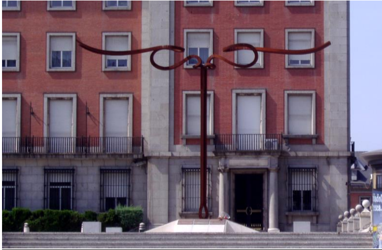
Fig. 11. Martín Chirino, Mirada del Horizonte II , 2006, en la Plaza Moncloa.

obras son trasladadas de su emplazamiento originario. A veces prevalece mantener un significado en el contexto en que se ubica, como el diálogo establecido entre las tres esculturas ( Monumento Víctimas de la Aviación Militar , Monumento a los Héroes del Plus-Ultra , Mirada del Horizonte II ) 45 que actualmente están instaladas en la Plaza de la Moncloa (Fig.11), frente al que fue Ministerio del Aire (Arroyo, 2012: 229-238).