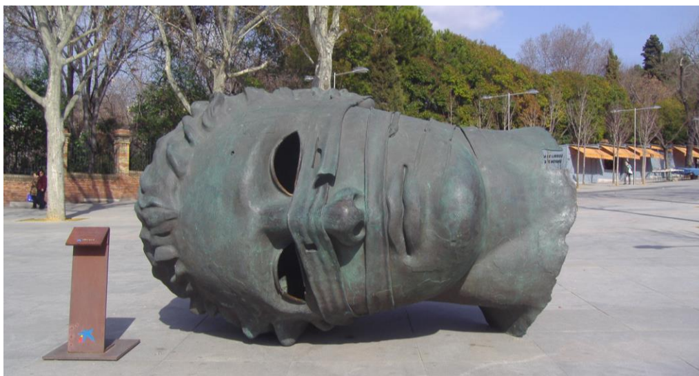
Fig. 10. Mitoraj en Cuesta Moyano, exposición Caixaforum, febrero 2008.

tectos María Langarita y Víctor Navarro 42 llevaron a cabo su rehabilitación y adaptación. Edificio cercano a Caixaforum y en el comienzo del Barrio de las Letras, entre sus objetivos se haya el incentivar el trabajo colaborativo desde diferentes perfiles, niveles y grados de implicación. Entre sus actividades de interés, por lo que supone del uso y ocupación del espacio exterior de la plaza, están convocatorias como “Fachada digital” del programa europeo Connecting Cities. En 2013 la propuesta temática de experimentación consistió en conectar entre sí ciudades, barrios y personas. Cabe destacar el trabajo de Pedro Valbuena: Entramado - Plaza de Luz , una instalación urbana en la Plaza de las Letras, proyecciones de luz sobre espacios físicos, un ejemplo de uso de la llamada escultura aumentada, que combina la realidad física y virtual.