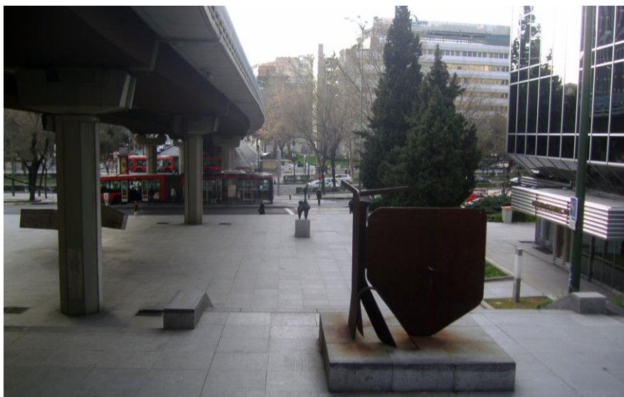
Fig. 2 – Museo Arte Público, vista general con obra de Palazuelo: Proyecto para monumento IV B , 1978, acero corten, febrero de 2008.

Si la Plaza Castilla ha ido adquiriendo la apariencia actual, espacio amplio y abierto cubierto de torres de distintas épocas y estilos y una actividad cultural significativa a través de la Fundación Canal, otro centro neurálgico anterior a destacar es el Puente de Eduardo Dato en cuyos bajos se asienta el Museo de Arte Público de La Castellana. Inaugurado oficialmente el 9 febrero 1979, su restauración integral se realizó en 2001-2002, (Fig.2).