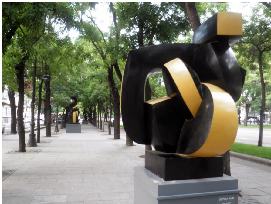
Fig. 8. Exposición en el Paseo de la Castellana de Sophia Vari, junio de 2011

Esta intervención de Sans Façon es una de las primeras manifestaciones de lo que a partir de ahora será bastante habitual en las programaciones que convierten temporalmente la calle y su arquitectura en museo al aire libre. Un nuevo ejemplo, entre otros, la muestra escultórica titulada Forma y Color de la artista griega Sophie Vari en el Paseo de la Castellana (Fig.8); organizada por la Junta municipal de Chamberí y el Ayuntamiento de Madrid, entre el 4 de abril y 4 de septiembre de 2011. Y, específicamente, referente a la relación de las nuevas obras de arte con los edificios y el espacio histórico existente, se ha intentado establecer diálogos de distinta naturaleza, como el generado entre la escultura de vanguardia clásica del museo de Arte Público de la Castellana y los distintos proyectos del “Madrid Abierto”.