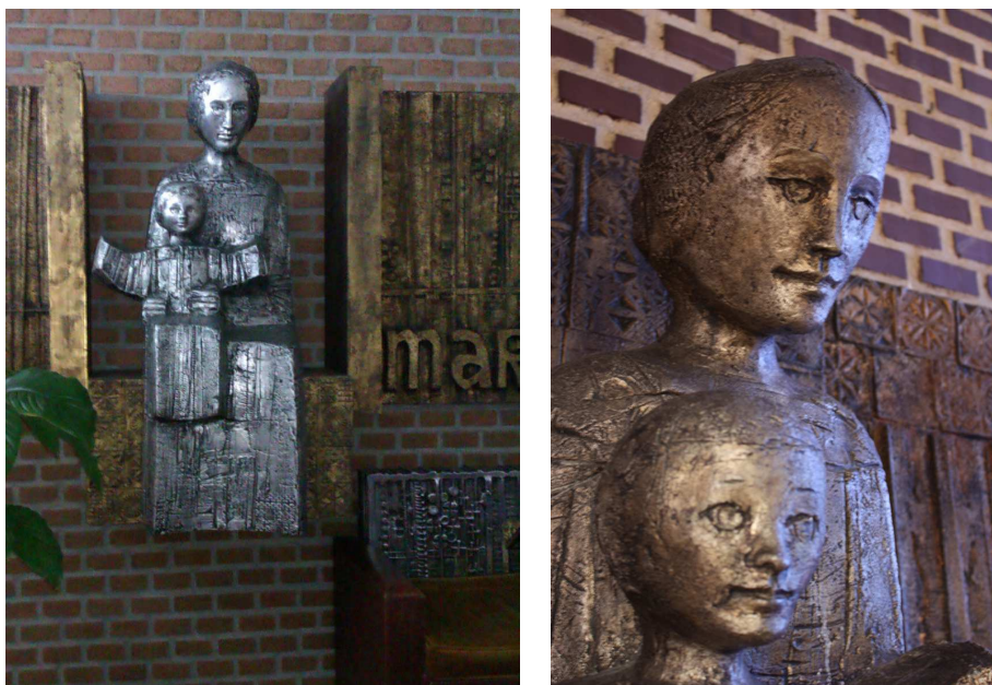
Figs. 6-7. Escultura de Virgen con el niño en la parroquias de San Fernando (1973) y Jesús de Nazaret (1974).

Por último, el artista situó una escultura de cemento metalizado de San Fernando en el exterior de la iglesia, próxima a la entrada. No existían más figuras en el templo, cumpliéndose así los preceptos posconciliares: pocas imágenes, correctamente situadas y realizadas en un estilo actual.