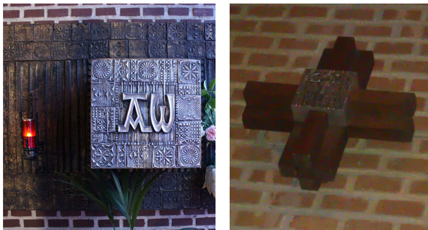
Figs. 8-9. Sagrario de la parroquia de Jesús de Nazaret (1974) y Vía Crucis de la parroquia de San Fernando (1973).

que pendía sobre el altar. Al igual que ésta, cada brazo se “construía” a partir de la agrupación de cuatro listones de sección cuadrada.