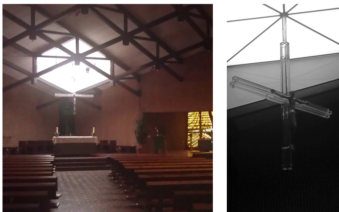
Fig. 4-5. Crucificado en la parroquia de San Fernando, Madrid, 1973.