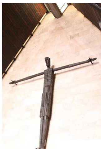
Figs. 2-3. Detalles del Crucificado en la iglesia del Poblado Dirigido de Canillas, Madrid, 1962.

A este respecto, el artista recordaba que la radical arquitectura de la iglesia de Canillas no permitía cualquier tipo de escultura: